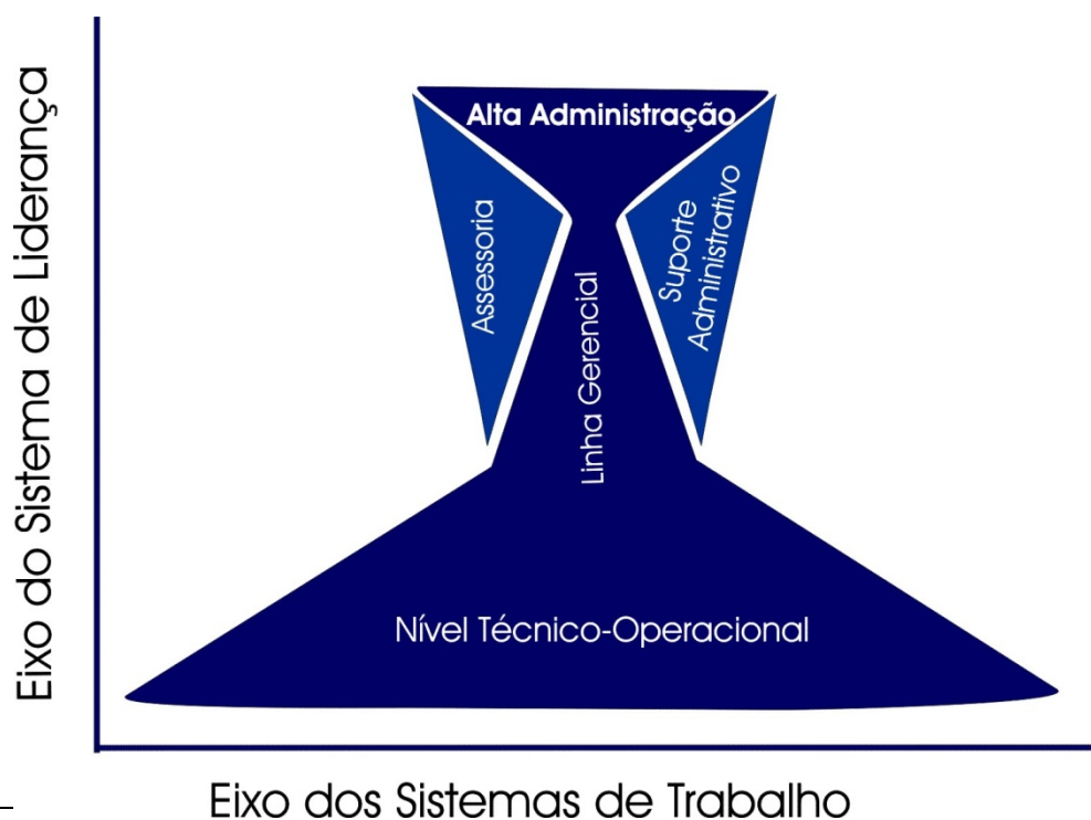
Figura 1 Representação gráfica dos componentes das estruturas do Poder Executivo Federal

Esses componentes organizam-se em dois eixos principais, conforme apresentação gráfica da Figura 1: